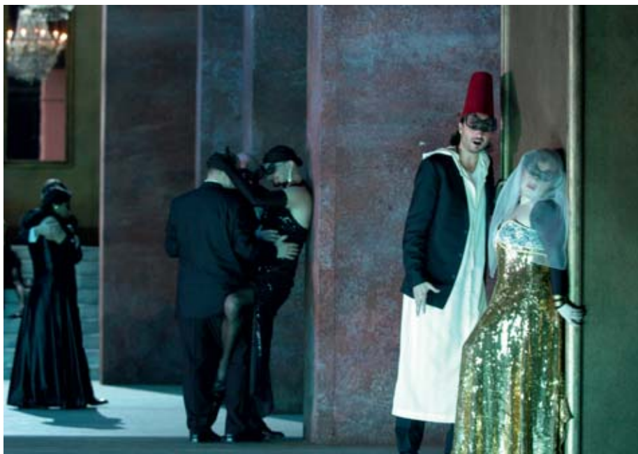
Szene aus „Il Turco in Italia“