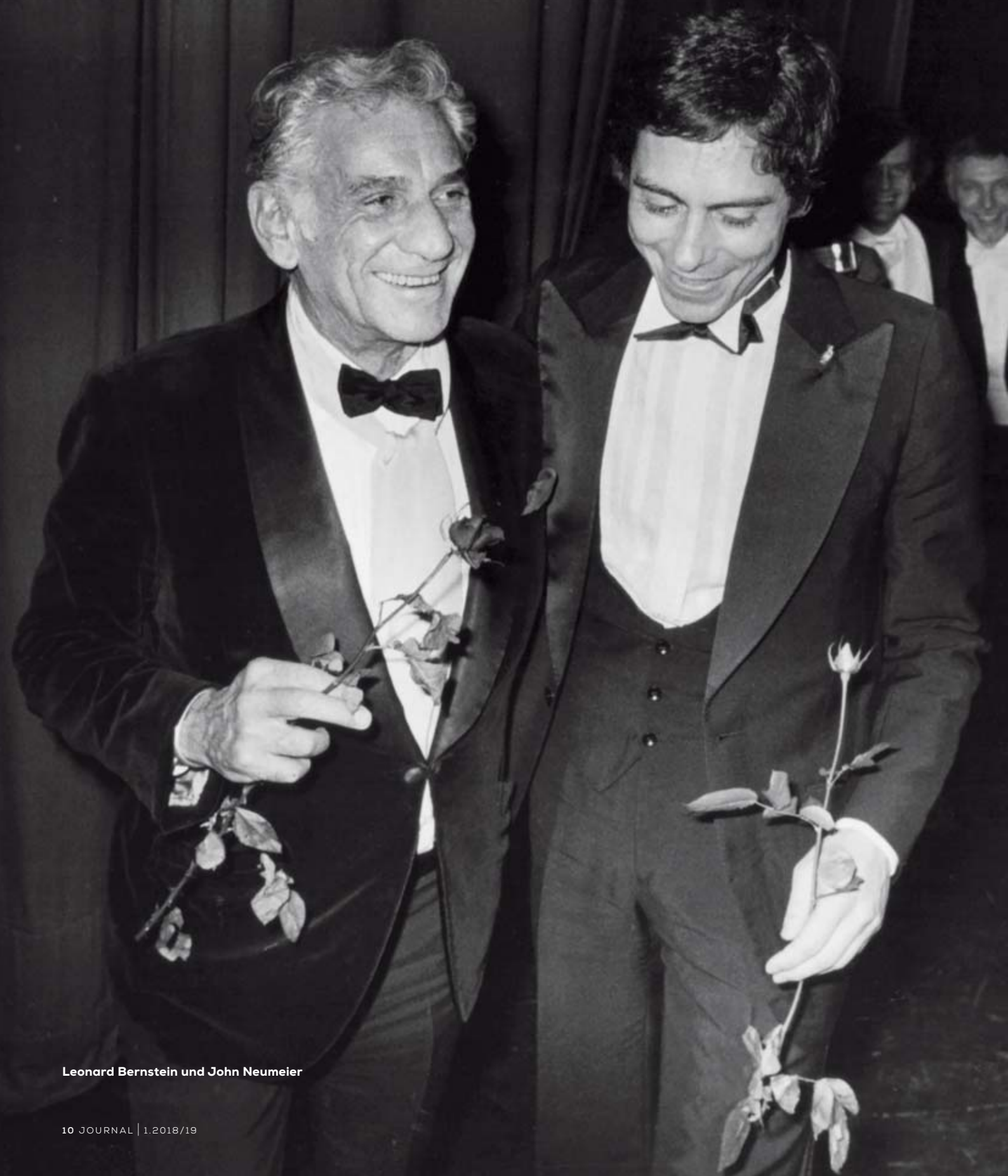
Leonard Bernstein und John Neumeier