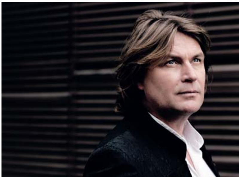
Klaus Florian Vogt, rechts als Paul in „Die tote Stadt“.

Startenor und Hamburger Publikumsliebling: Klaus Florian Vogt kehrt für zwei Vorstellungen von Korngolds Die tote Stadt an die Staatsoper zurück.