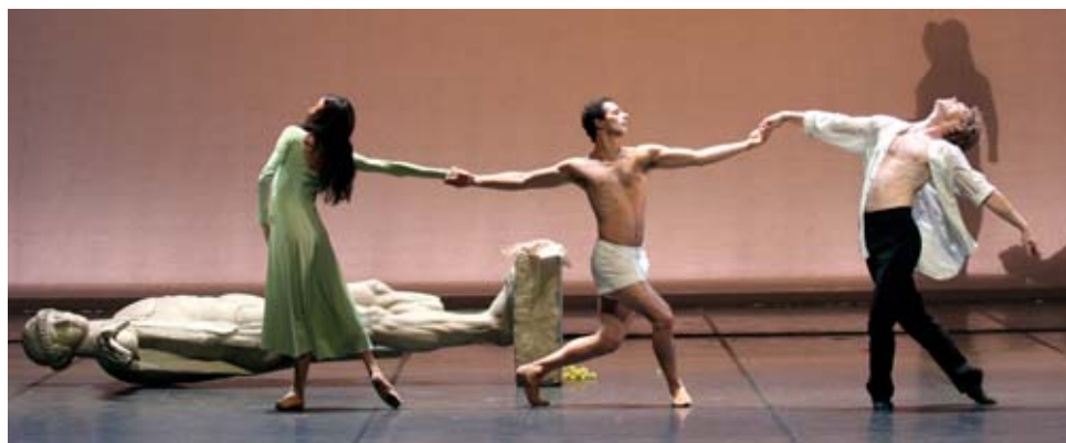
»Der Nachmittag eines Fauns«