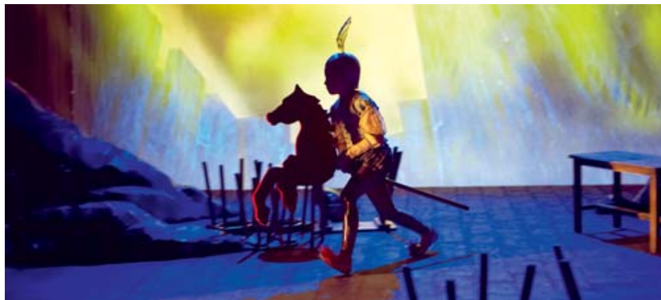
»Die schwarze Spinne«